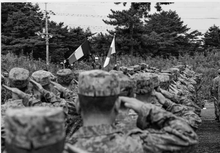
Exercice Brunet-Takamori 2024 aux côtés des forces d'auto-défense japonaises.

Dans le même temps, la 3 e division entretient ses savoir-faire de combat en haute intensité.