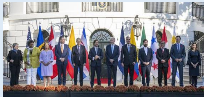
Sommet de Washington. 3 novembre 2023.

Le Président BIDEN a lancé les 2 et 3 novembre 2023 à Washington, le premier sommet de l'Alliance pour la prospérité économique des Amériques avec plusieurs chefs d'État du continent. Il rappelait ainsi non seulement les liens que les États-Unis gardent avec le continent dont ils restent le premier investisseur mais également l'accent mis sur le développement économique, source de stabilité durable. Il a rappelé la complexité de la situation : la géographie, la problématique migratoire et les enjeux économiques constituent le moteur d'un sommet qui se retrouvera en 2025 au Costa Rica.