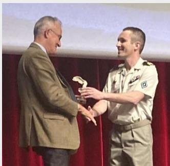
CBA P. LUTET