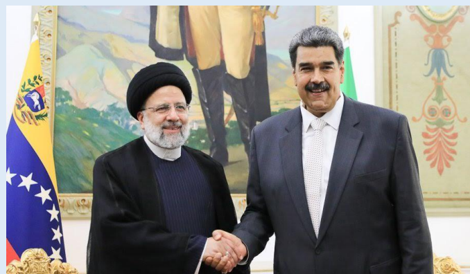
Rencontre entre l'ancien président de la République islamique Ebrahim RAISSI, et le Président de la République bolivarienne du Vénézuéla, Nicolás MADURO. Caracas Juin 2023. Tous droits réservés, crédits photo : Ministère des affaires étrangères du Vénézuéla.

Pour Washington, le sentiment d'une possible « prise à revers » existe, dans une approche géostratégique. Il devient pour les États-Unis, indispensable de la stopper net sous peine de voir l'Amérique latine redevenir un espace d'instabilité.